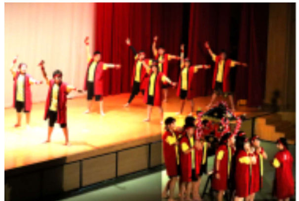
2年生出し物課によるダンスとおみこし