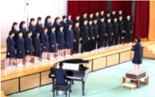
3年生の歌声を後輩が3年ぶりに生で聞けました

10月22日(土)校内合唱コンクール・文化祭が行われました。本年度は秋休みを挟んでの短い準備期間で、各生徒がそれぞれの役割分担を果たし、主体的な取組で思い出に残る行事を作り上げていました。当日は感染症対策のため保護者観覧を制限しましたが、12月14日(水)の学年PTAの際には、これらの行事の様子を見ていただく場面を設定したいと思っております。